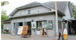
レンタル機材の貸し出し・売店