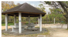
水道設備がある炊事棟が2棟あります。